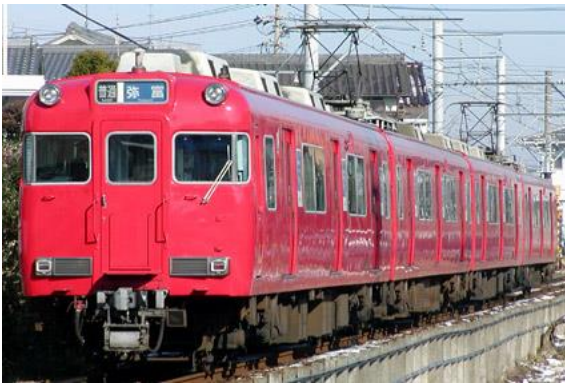
名鉄 6000 系