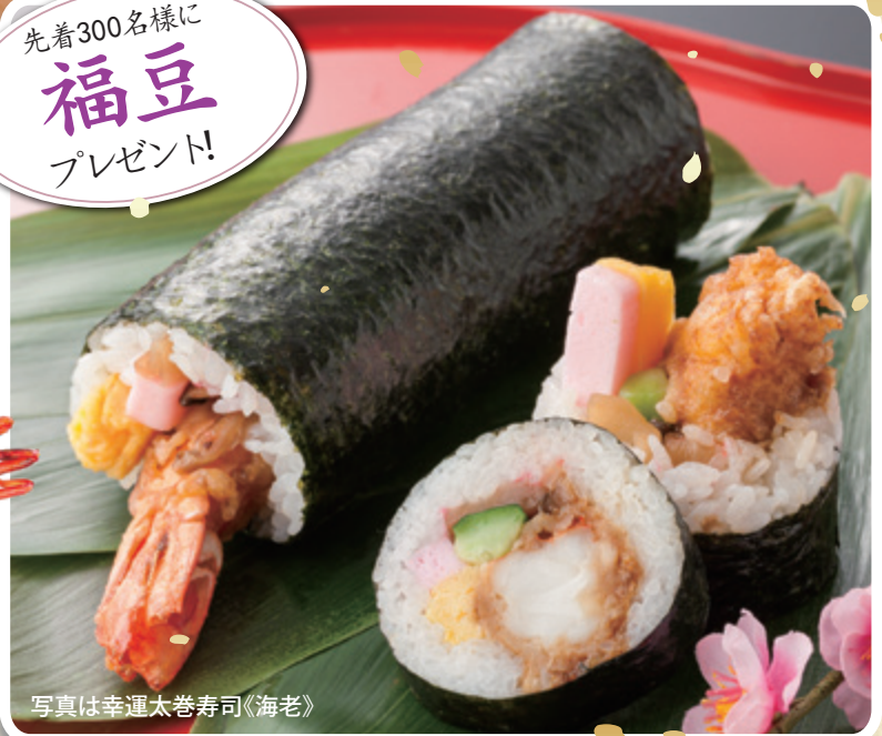
写真は幸運太巻寿司《海老》