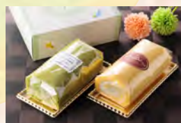
(写真はイメージです。)